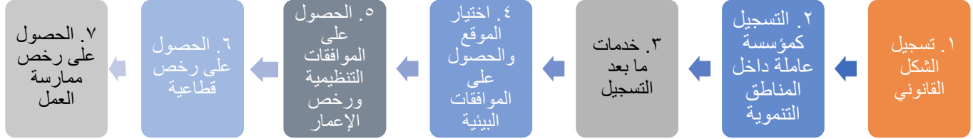
شكل رقم (٣) - خطوات ممارسة الأنشطة الاقتصادية في المناطق التنموية في الأردن ٢

يغطي هذا الجزء من الدليل الخطوات الأساسية من أجل البدء بممارسة النشاط الاقتصادي في المناطق التنموية، ويبين الشكل رقم (٣) أدناه خطوات ممارسة الأنشطة الاقتصادية في المناطق التنموية.